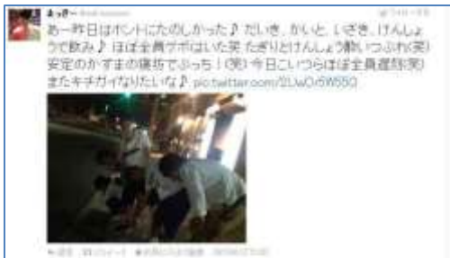
未成年飲酒などを自ら公表