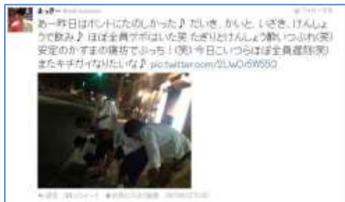
未成年飲酒などを自ら公表